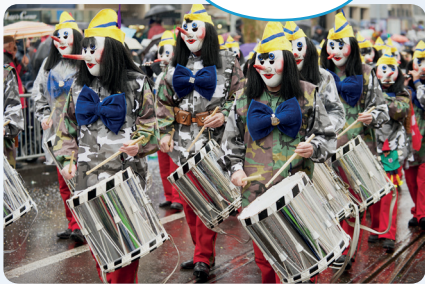
9. Fasnacht in Basel