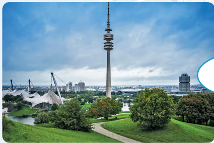
10. Olympiapark in München