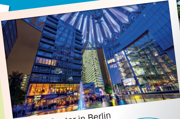
3. Sony Center in Berlin